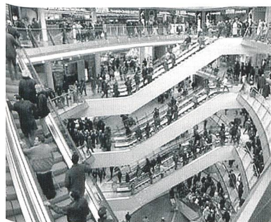
Stromverbrauch in Europa wächst (neues Einkaufszentrum in Kassel).