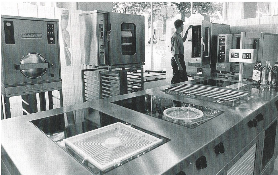
Kleine und mittlere Unternehmen (KMU) sind zum Teil besonders stromintensiv (z. B. Gastronomie).