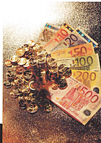
Mehrwertsteuer nun am Ort des Stromverbrauchs.

Sowohl in der 6. EG-Richtlinie als auch im Bundesgesetz über die Mehrwertsteuer (MWSTG) werden Energien jeglicher Art umsatzsteuerlich wie körperliche Sachen behandelt und unterliegen demzufolge der Lieferungsbesteuerung 3 . Nach dem Willen der EU-Kom-