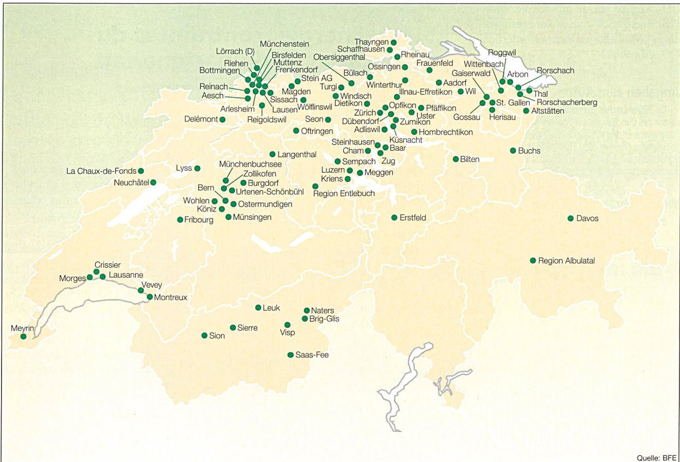
Bild 1 Schweizer Energienstädte

sen. Die Differenz wird in der Dezember-Session bereinigt 1) . Die Kürzungen sollen je nach Szenario wie in Tabelle II umgesetzt werden: