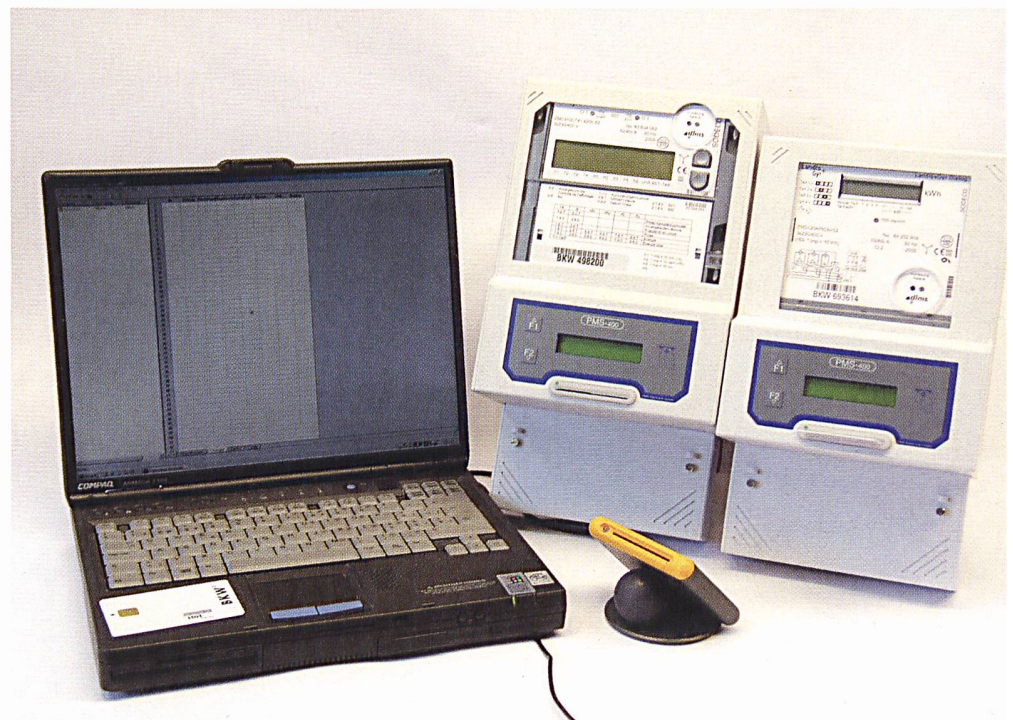
Bild 1 Systemkomponenten.

Parallel zur technischen Einführung und der Anwenderschulung sollte auch der bis dahin in den Regionalvertretungen unterschiedlich gelöste Inkassoprozess vereinheitlicht werden. Es nahm viel Zeit in Anspruch, diesen Prozess zu erstellen. Die Anwenderschulung in den Regionalvertretungen wurde schliesslich von Frühling bis Herbst 2004 durchgeführt. Die gewählte Art der Schulung, eine Mischung aus Frontalunterricht und