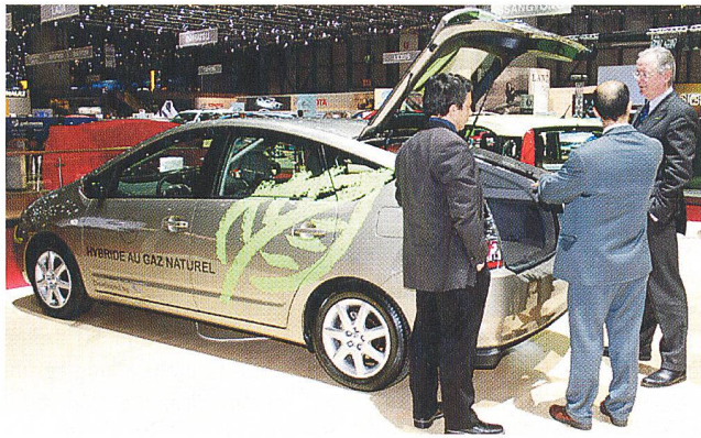
Die beiden Erdgas-Druckflaschen im Kofferraum haben ein geometrisches Volumen von je rund 20 Litern und lassen genügend Platz für Gepäck.

(we) Während des 76. Autosalons in Genf war am Stand EcoCar-gasmobil-e'mobile ein besonderes Hybridfahrzeug zu sehen: ein Prius II CNG, der sowohl mit Erdgas als auch mit Benzin fährt.