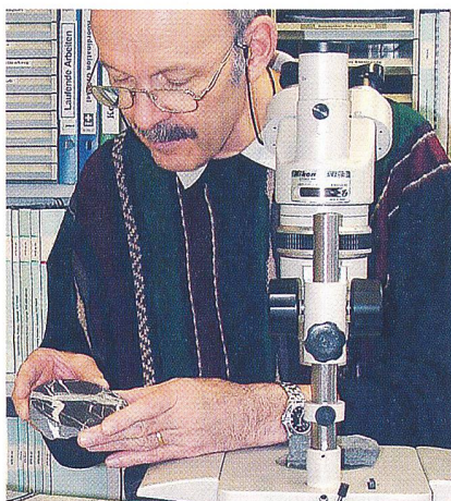
Bilder 1 und 2: Ein systematischer Wissenstransfer dient der Bewahrung von Kenntnissen und Erfahrung beim Personalwechsel.