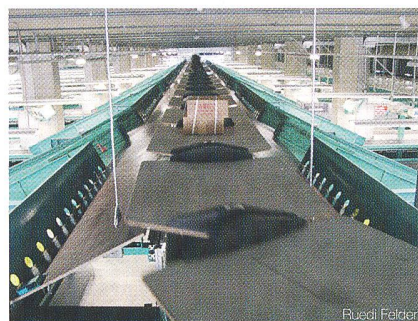
Die Gepäckabfertigung am Flughafen Kloten darf nicht stillstehen. Dazu braucht es aber keine teuren, proprietären Systeme, es reichen standardisierte SPS-Steuerungen.

Die Tagung erläutert Lösungen von standardisierten, hochverfügbaren SPS-Steuerungen, Rechnersystemen und Netzwerktechnologien. Anwendungsbeispiele