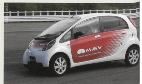
Das Elektroauto von Mitsubishi dürfte sich vor allem für Pendler eignen, die weniger als 100 km fahren pro Tag.

Auch der Komfort stimmte für die Bieler Testfahrer: Die Heizung bringt das Auto im Winter auf angenehme Temperaturen, und der Elektromotor beschleunigt gleich schnell wie ein Benziner. Nur auf der Autobahn steigt der Verbrauch schnell an, und die Reichweite sinkt auf 80 km. Mit einer speziellen Ladestation lässt sich das Elektroauto allerdings in 20 min zu 80% laden. So würde der Nachteil der Elektroautos wegfallen, dass das Tanken stundenlang dauert. Voraussetzung ist, dass die Ladestationen in der Region gut verteilt sind, beispielsweise bei Raststätten auf der Autobahn. So könnte man das Auto aufladen, während man einen Kaffee trinkt. Mitsubishi will den iMIEV 2010 in Europa einführen. Wann er in der Schweiz erhältlich sein wird, ist offen. (BKW/gus)