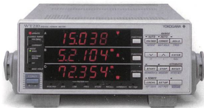
Leistungsmessgerät Yokogawa WT210 von Emitec.

Es gibt unzählige Stromfresser, nicht nur im Haushalt, sondern auch in den Unternehmen. Der Stromverbrauch vieler kleiner und unscheinbarer Geräte summiert sich und lässt die Stromrechnung merklich steigen. Viele Entwickler, Labors und Stromversorger vertrauen auf ein Strom- bzw. Leistungsmessgerät von Yokogawa und kontrollieren damit ihre Stromrechnung. Ein Laborgerät, das täglich nur 3 h in Betrieb ist, jedoch 15 W im Stand-by-Mode ver-