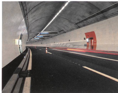
Beleuchtung von TridonicAtco im Üetlibergtunnel.

Die Westumfahrung Zürich mit ihrer grossen Zahl einzelner Spezialbauwerke stellt hohe Anforderungen an die Licht- und Sicherheitstechnik. In den Durchfahrtszonen der Tunnel sind Aura-Ultimate-Long-Life-Lampen mit TridonicAtco-Vorschaltgeräten in Siteco-Leuchten eingesetzt. Das energieeffiziente Vorschaltgerät PCA hp