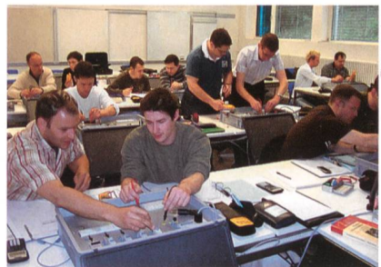
Im Kurs lernen die Teilnehmer die Messgeräte kennen.