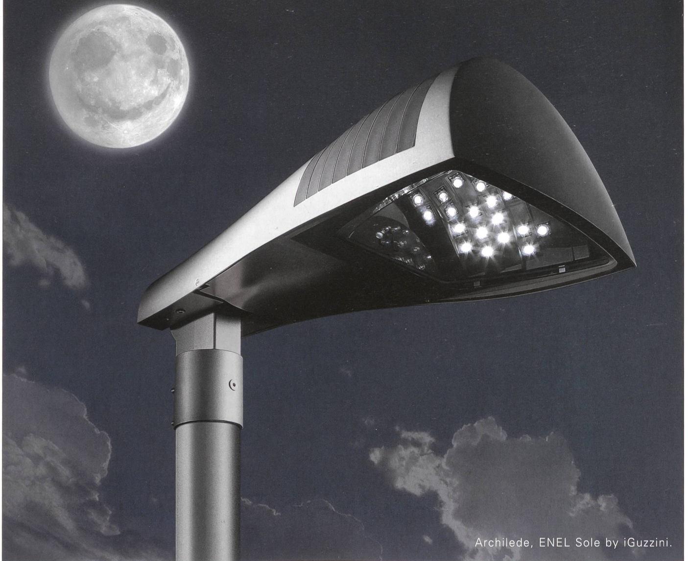
Archilede, ENEL Sole by iGuzzini.

Mit den neuen LED-Systemen, die iGuzzini für die Beleuchtung im öffentlichen Raum entwickelt hat, lässt sich der Stromverbrauch im Vergleich zu den allgemein gebräuchlichen Systemen drastisch senken (um bis zu 40%! ). Noch dazu verbessern sie die Lichtqualität und reduzieren die Umweltbelastung durch Lichtemissionen. Das tut nicht nur den Taschen der Bürger gut, sondern auch ihrem Wohlbefinden, ihrer Sicherheit und ganz nebenbei auch noch der Gesundheit des Nachthimmels, der in unserer heutigen Welt mit Millionen von Lichtern bombardiert wird.