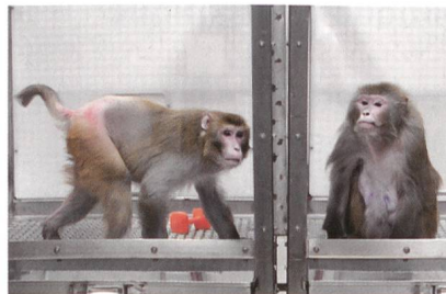
University of Wisconsin-Madison

Die hungernden Tiere lebten nicht nur länger, sie waren auch gesünder. Typische Altersleiden, die Rhesusaffen wie Menschen zu schaffen machen, traten deutlich weniger auf: Herz-Kreislauf-Krankheiten und Krebs halbierten sich, Diabetes trat überhaupt nicht mehr auf. Auch geistig schien sich die karge Kost zu bewähren. Während die normal ernährten Affengruppe graue Substanz einbüssten in Hirnbereichen, die für die Motorik,