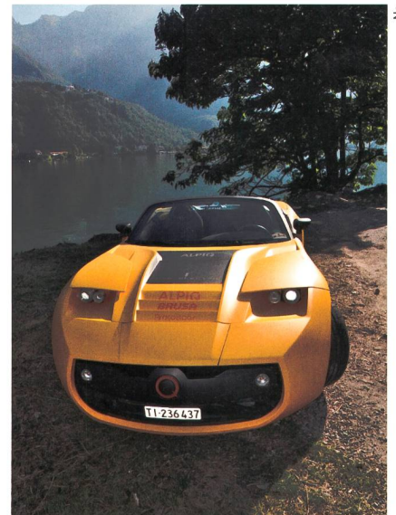
Bild 1 Das Lampo 2 -Cabriolet von Protoscar ist in 5 s von 0 auf 100 km/h.

Zebra-Batterien sind Natrium-Nickelchlorid-Batterien, die bei Temperaturen über 245 °C betrieben werden. Sie unterscheiden sich von konventionellen Batte-