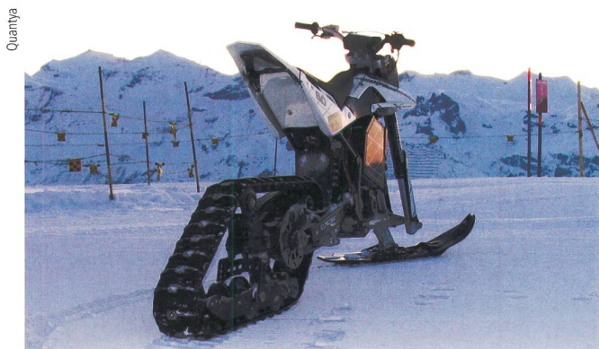
Bild 3 Auch im Schnee macht die elektrische Fortbewegung Spass. Das Enduro-Modell von Quantya lässt sich mit einem Bausatz umbauen.