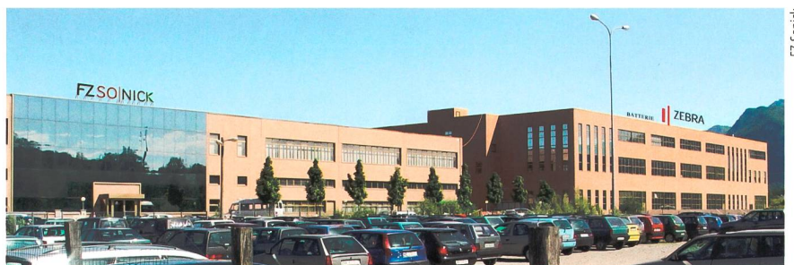
Bild 2 FZ Sonick in Stabio, die frühere Mes-Dea, stellt seit über 10 Jahren Zebra-Batterien her.

Wird das Fahrzeug mehrere Tage abgestellt, muss es einerseits zum Laden der Batterie angeschlossen werden, andererseits um die Batterie über 245 °C zu halten, damit sie einsatzfähig bleibt. Der thermische Verlust der vakuumisolierten Batterie beträgt rund 100 W – lange Standzeiten werden also nicht empfohlen, da der Gesamtwirkungsgrad dadurch stark beeinträchtigt wird. Ein weiterer Nachteil ist die durch den relativ grossen Innenwiderstand bedingte geringe spezifische Leis-