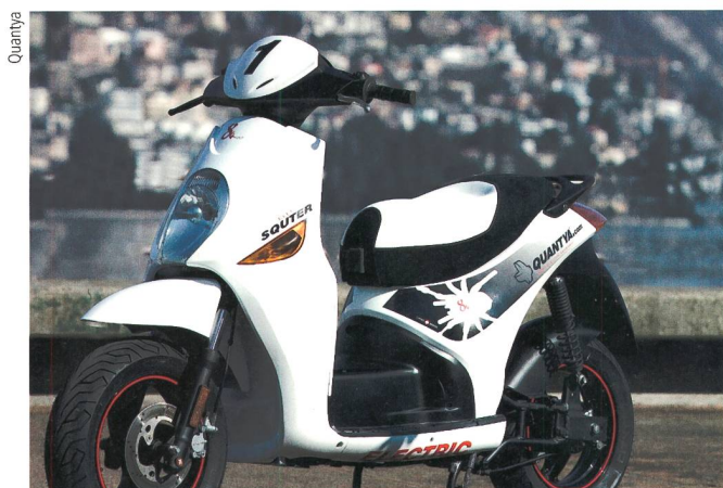
Bild 4 Der elektrische Scooter von Quantya soll den Massenmarkt erobern. Über 1000 Vorbestellungen sind bereits eingegangen.

tung, die etwa einen Drittel von den anzustrebenden 500 W/kg beträgt [2].