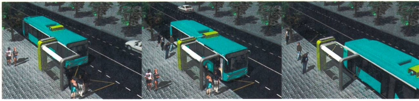
Figure 2 Couplage par bras articulé, tel qu'il est prévu dans le projet WATT.