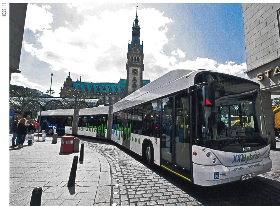
Figure 1 Le bus hybride lighTram3 de HESS.

La très faible résistance interne des supercapacités permet une grande efficacité lors des transferts d'énergie fréquents caractéristiques du concept BoostBus. Les éléments-clés du système sont représentés dans la figure 3 [5].