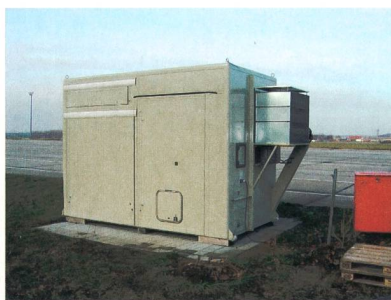
Figure 5 Exemple de station de recharge rapide.

Parmi les solutions les plus discutées se trouvent l'induction [13-15], le pantographe (figure 6) [16, 17] et le bras articulé (figures 2 et 6) [4, 16]. Chaque solution a ses particularités. Le tableau 2 présente une liste non exhaustive des aspects à considérer lors de la comparaison de ces différents systèmes.