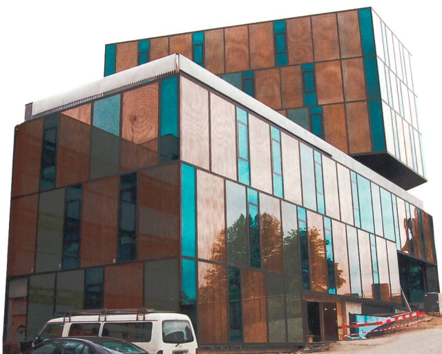
Figure 1 Nouveau bâtiment du Centre professionnel de Fribourg, entièrement vitré et à fort apport solaire passif. Différents types de vitrages sont mis en œuvre pour bénéficier au mieux de l'apport énergétique solaire.

Derrière les vitrages de couleur grise de la figure 1 sont disposés des panneaux translucides d'une épaisseur de 2 cm qui renferment un composant biphasique (liquide-solide). Il s'agit d'eau à très forte