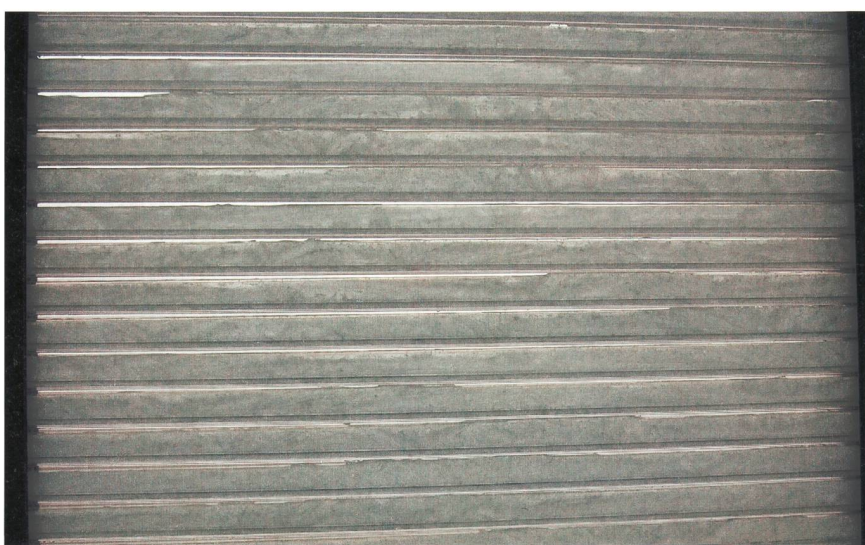
Figure 3 Panneau PCM (Phase Changing Material) disposé derrière le vitrage isolant pour atténuer les élévations de température dans la salle.

teneur en sel, qui cristallise lorsque la température passe en dessous de 24 °C et se liquéfie lorsque la température remonte au-dessus de cette limite. Durant le changement de phase solide-liquide, le panneau ( figure 3 ) accumule énormément d'énergie sans monter en température. Il modère ainsi l'échauffement du local durant les chaudes journées d'été. Durant la nuit, le panneau restitue son énergie et son contenu redevient solide. L'effet d'un panneau PCM (Phase Changing Material) de 2 cm est similaire à celui d'un mur de béton de 30 cm d'épaisseur.