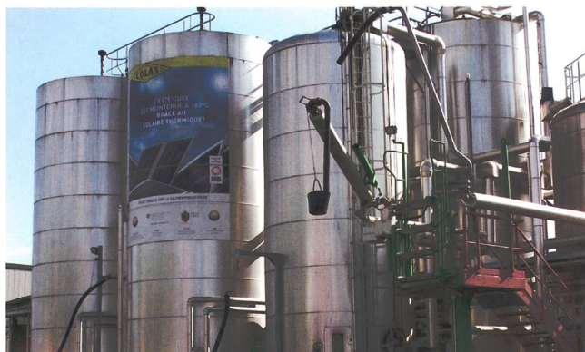
Figure 2 Les cuves de goudron de l'entreprise Colas sont chauffées à 180°C.