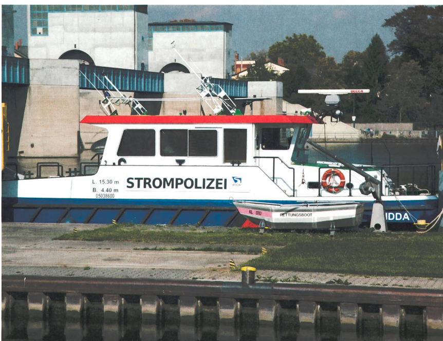
Die Strompolizei sorgt in Frankfurt a.M. dafür, dass sich Ladungsträger ordnungsgemäss verhalten.