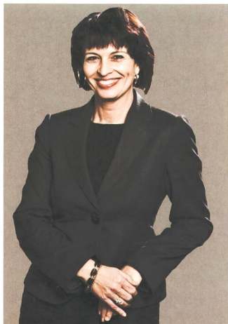
Keynote Referat von Bundesrätin Doris Leuthard