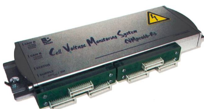
Das CVM kann bis zu 90 Batteriezellen gleichzeitig überwachen.

Pewatron AG, 8052 Zürich Tel. 044 877 35 00, www.pewatron.com