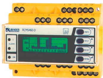
RCMS460-D verfügt über einen ausfallsicheren Historienspeicher mit bis zu 300 Datensätzen.

Optec AG, Wetzikon Tel. 044 933 07 70, www.optec.ch