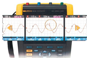
Das für industrielle Umgebungen entwickelte, tragbare Oszilloskop ScopeMeter 190 Serie II.