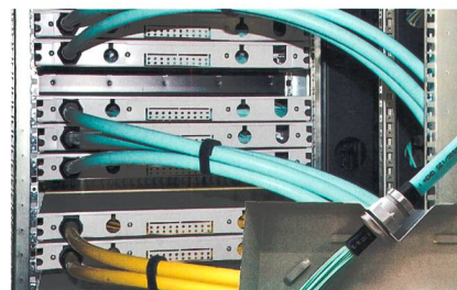
Die mit LWL-Steckern vorkonfektionierten BreakOut-Kabel lassen sich einfach verarbeiten.

Dätwyler Schweiz AG, 6460 Altdorf Tel. 041 875 12 68, www.daetwyler-cables.com