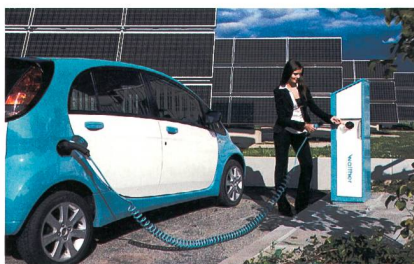
Ladesäule mit diversen Identifikationssystemen: RFID, SMS und PIN werden akzeptiert.