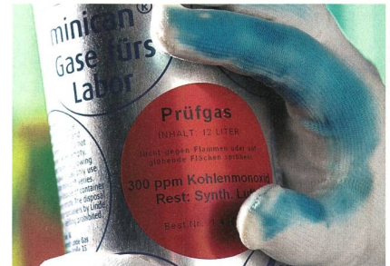
Der Sensorhandschuh färbt sich in Gegenwart eines Gefahrstoffs blau.