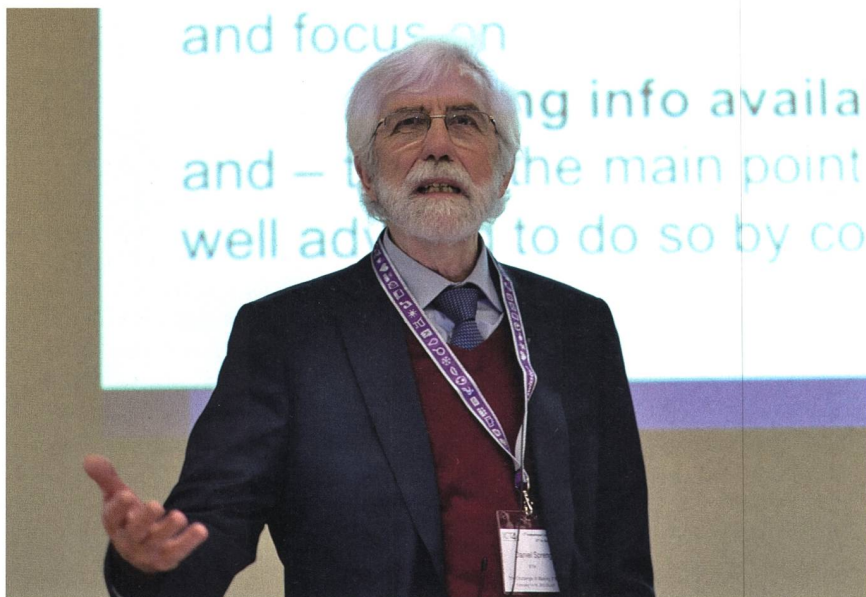
Der emeritierte ETH-Professor Daniel Spreng erläuterte die Beziehungen von Information, Energie und Wachstum und plädierte aus energetischen Gründen für qualitatives statt quantitatives Wachstum.

Eine relevante Frage stellte sich ein österreichisches Team: Kann man mit intelligenten Stromzählern Energie sparen? Die Untersuchung zeigte, dass der eigentliche Smart Meter den Hauptanteil des Energieverbrauchs des gesamten Erfassungssystems stellt, wobei Power Line Communication deutlich energieinten-