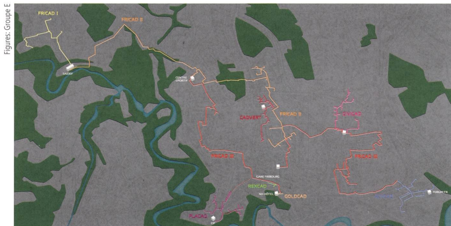
Figure 3 Après extension, le réseau Fricad totalisera 40 kilomètres de conduites CAD.

La turbine à air chaud Fernwärme Düringen fait partie des premiers projets en Suisse inscrits au « programme phare » de l'OFEN. Ces projets utilisent des tech-