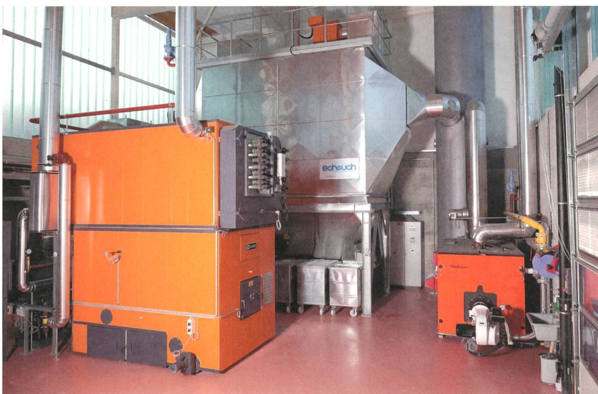
Figure 1 La combustion de plaquettes de bois dans une chaudière permet de valoriser une énergie renouvelable et locale.

Le chauffage à distance La Tour-de-Peilz permet de produire de l'énergie d'une manière particulièrement respectueuse de l'environnement. À part son passage dans des filtres, l'eau du lac n'est pas traitée et sa qualité reste inchangée.