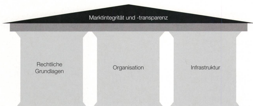
Bild 1 Drei Säulen zur Schaffung von mehr Marktintegrität und -transparenz.

Die ElCom und die Schweizer Behörden sind sich der Herausforderung bewusst, dass die Schweiz als Nicht-EU-Mitglied über andere rechtliche Rahmenbedingungen im Elektrizitätsbereich verfügt. Der Bundesrat fügte da-