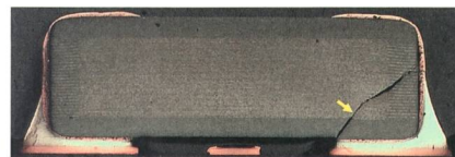
Bild 2 Bruchstelle in einem Keramik-Kondensator (Schliffbild). Der Bruch ist von oben durch die Lötkepappe verdeckt und durch Inspektionen nicht erkennbar. Häufig entstehen nur winzige Risse, die erst nach längerer Zeit zu Kurzschlüssen führen.

Günter Grossmann, Empa, referierte anschliessend über Lötprobleme beim