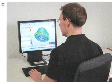
Mittels FEM-Simulation testet dieser IPH-Ingenieur die Umformung eines Stahlkolbens.

Das Ziel der Forscher ist ein selbstlernender Algorithmus, der die Ergebnisse von FEM-Simulationen vorhersagen kann und schnell eine möglichst genaue Vorschau liefert. Das nötige Wissen dafür soll sich der Algorithmus mittels Data Mining selbst aneignen, indem er Datensätze von FEM-Simulationen analysiert und darin Muster erkennt, die er dann auf andere Umformprozesse anwenden kann. No