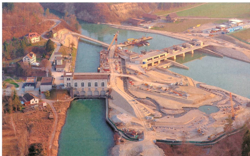
Figure 1 Construction de la nouvelle centrale hydroélectrique et de son impressionnant canal de dérivation pour les poissons (au premier plan).

La division BKW Engineering s'est chargée de la planification de la nouvelle centrale hydroélectrique. Elle compte une centaine de spécialistes et couvre les domaines de la construction hydraulique, des ouvrages en béton, des techniques de commande, de la construction hydraulique en acier (vannes, grilles, batardeaux), de l'architecture, ainsi que de l'électromécanique. Les spécialistes de BKW ont fourni les prestations suivantes :