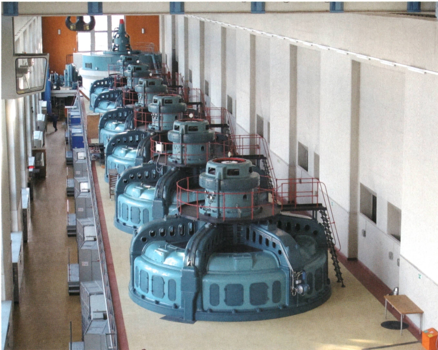
Bild 3: Wasserkraft (im Bild Turbinen im Wasserkraftwerk Mühleberg) ist investitionsintensiv.

perfekten Preiskenntnissen dar. Unter Berücksichtigung realer Anlagen- und Marktrestriktionen (Speichervorhaltung, limitierte Marktgrösse und Unsicherheit über zukünftige Preise) reduziert sich das Einnahmepotenzial deutlich.