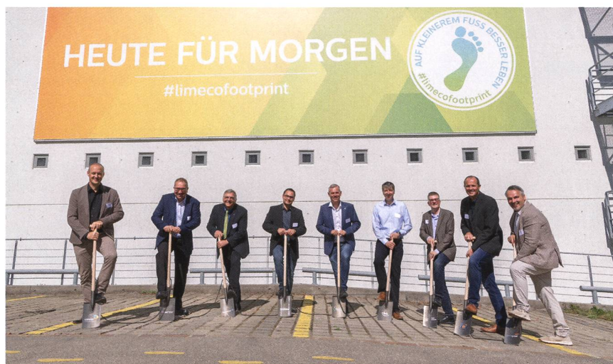
Die Verantwortlichen beim Spatenstich.

Auf dem Areal des Limmattaler Regiowerks Limeco in Dietikon entsteht die bis anhin grösste Power-to-Gas-Anlage der Schweiz mit einer Elektrolyse-Leistung von 2,5 MW. Ab Winter 2021/22 wird sie erstmals synthetisches erneuerbares Gas ins Netz einspeisen.