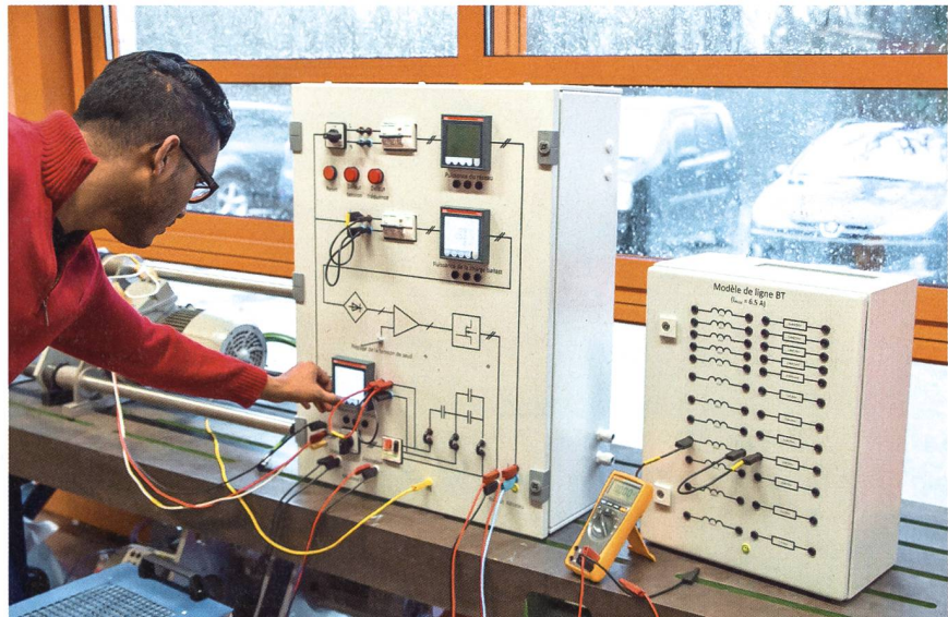
Dans les domaines énergétiques, les travaux pratiques de laboratoire constituent l'un des éléments fondamentaux de l'enseignement.

possible de demander à un ingénieur électricien de devenir simultanément chimiste et thermodynamicien lorsqu'il devra intégrer des batteries ou un stockage à air comprimé dans un réseau; néanmoins, il devra être en mesure de comprendre les éléments les plus importants et les limitations des systèmes non électriques qu'il est censé intégrer, et ce, de manière plus que « superficielle ». Il va sans dire que ces « mariages » vont se multiplier dans les systèmes énergétiques du futur: batteries, réseaux électriques, gaz naturel, hydrogène, chauffages à distance, unités de cogénération, piles à combustible, stockages hydropneumatiques, etc.