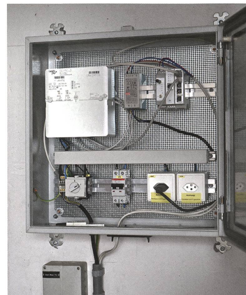
Der Datenkonzentrator sammelt die Zählerdaten und leitet sie weiter an das Rechenzentrum.