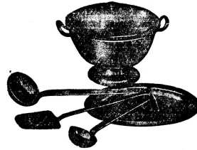
Alle Küchengeräte nur von SCHWABENLAND & CIE AG. Nilschelestr. 44 Zürich 1

„Geben Sie sich Mühe hineinzucommen!“ I. M.