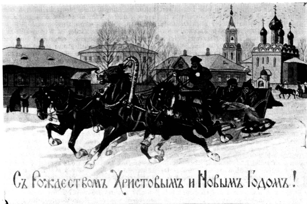
Съ въжакетъ воваъ Христовымъ и Новымъ Годомъ!

Zum Christbaum wurden immer viele bekannte Kinder eingeladen, und mein Onkel dachte für uns stets interessante Spiele aus. Unter dem Weihnachtsbaum lagen Geschenke für alle Anwesenden. Wenn die Kerzen niedergebrannt waren, wurden sie verteilt. Die Mädchen bekamen gewöhnlich Puppen, die alle gleich gross waren, damit sich niemand beleidigt fühlte, tragen aber verschiedene Kleider. Die Buben erhielten Bücher, Pferdchen und anderes Spielzeug — auch alles von derselben Qualität. Ich habe niemals mit Puppen gespielt und liebte nur