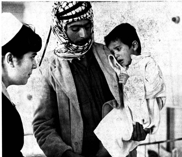
Ein Palästinaflüchtling bringt seinen Sohn zur Untersuchung in das Libanesisches Krankenhaus für Physiotherapie