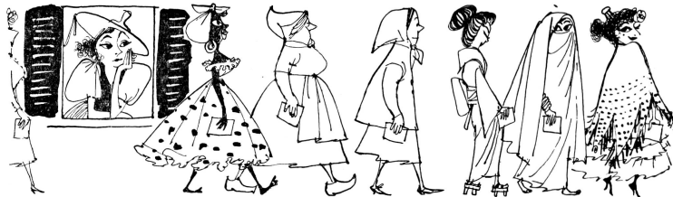
Als auch die Waadtländerinnen erst vom Frauenstimmrecht träumten.

Aus dem Aprilheft 1961 der «Deutschen Rundschau». Leicht gekürzt.