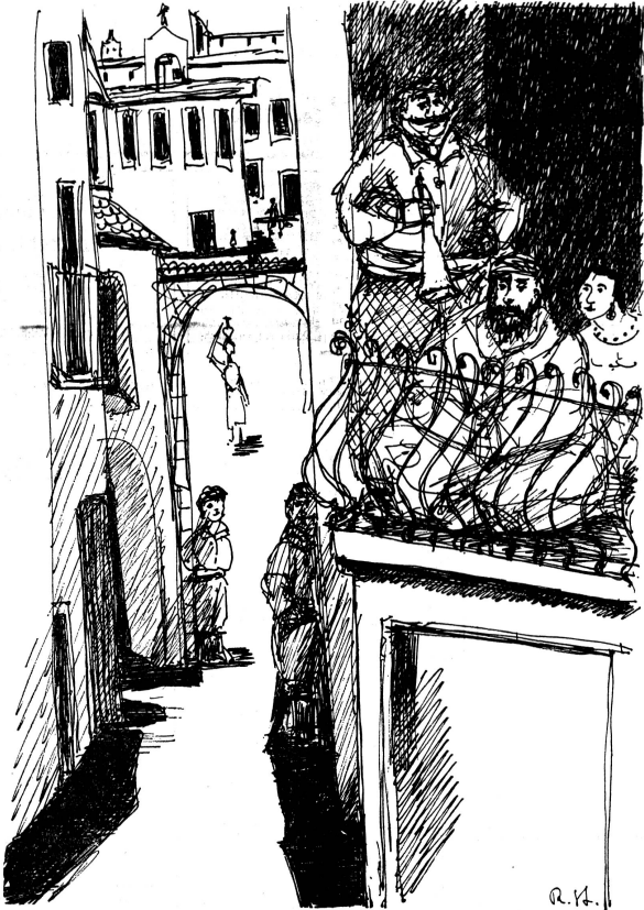
Dünyá tabir, ruyá tabir, amán, amán!