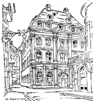
Stadthaus in Basel, Sitz der Bürgergemeinde