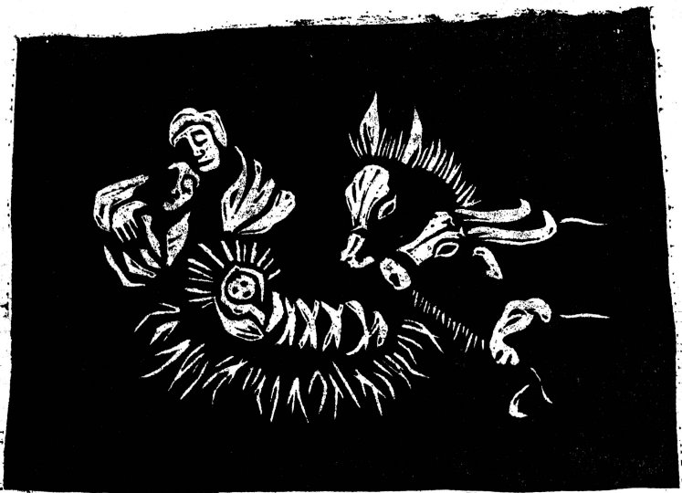
Holzschnitte von Ruth Steinegger