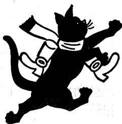
Illustration aus «Kater Mikesch»