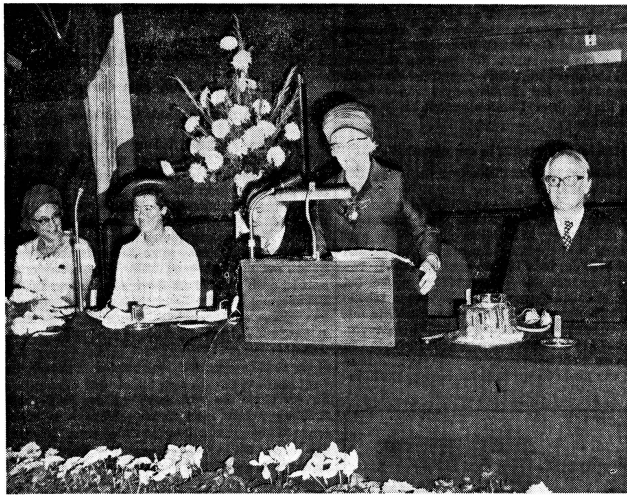
Eröffnungszereemonie des 11. Kongresses der International Federation of Business and Professional Women. Montag, 19. August 1968.