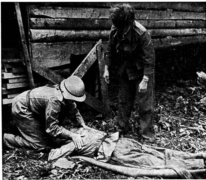
Den Frauen ermangelt es nicht an einer besonderen Einstellung und zarten Hand für die sachgemässe Behandlung von Verletzten.

In Zusammenarbeit mit dem Bundesamt für Zivilschutz, den Zivilschutzstellen der Kantone und Gemeinden steht heute das Gerippe des schweizerischen Zivilschutzes, wobei in allen Landesteilen noch grosse Unterschiede anzutreffen sind, da sich noch lange nicht alle Behörden ihrer grossen Verantwortung für die Ueberleben von Volk und Heimat bewusst geworden sind. Es geht heute darum, das Gerippe auf der guten und unseren Gegebenheiten angepassten gesetzlichen Grundlage mit Leben zu erfüllen und den Zivilschutz so stark und wirkungsvoll auszubauen, wie es für die militärische Landesverteidigung schon seit Jahrzehnten selbstverständlich ist.