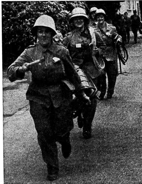
Erfreulich ist die Mitarbeit der Frauen in der Zivilschutzorganisation von Münchenbuchsee

Wenn wir auch hoffen, dass der Zivilschutz nur in den seltensten Fällen bei grossen und grössten Naturkatastrophen eingesetzt werden muss, so wird die Absolvierung eines Kurses innerhalb der zahlreichen Zweige der Zivilschutzorganisationen jeder Frau empfohlen. Mit den erworbenen Kenntnissen, findet sie sich nicht nur im Katastrophenfall zurecht, sondern auch im Alltag, im Familienleben. Weiss man sich selbst zu helfen und verliert man nicht den Kopf beim allerkleinsten Unglück, dann verliert die Gefahr sehr viel von ihrer schrecklichen Ohnmacht, wir können uns dann zurecht finden, um uns und dem Nächsten zu helfen.