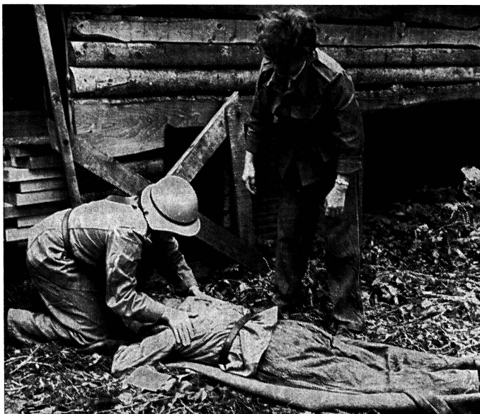
Zivilschutz ist Sache aller. Nur ein gut funktionierender Zivilschutz gibt uns die Möglichkeit, im Katastrophenfall zu überleben. Zivilschutz geht auch in ganz besonderer Masse die Frau an. In zahlreichen Kursen wird sie fachlich und technisch ausgebildet, damit sie im Ernstfall ihren Mann stellen kann.