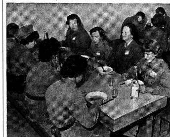
Besonders an uns Frauen geht der Appell, sich für die vielfältigen Aufgaben des Zivilschutzes voll und ganz einzusetzen. In den einzelnen Dienstzweigen der Zivilschutzorganisationen lenkt nicht bloss das Verhalten in einem Katastrophenfall – sie kann das Gelernte gerade im Alltag verwenden.

Dauer der Ausbildung – ein äusserst aufschlussreicher und nicht zu überschender Punkt. In der Hauswehr erfolgt die Ausbildung am Wohnort in Halbtages- oder Tageskursen. Neu eingeteilte Angehörige der örtlichen Schutzorganisationen und des Betriebsschutzes absolvieren einen Einführungskurs bis zu drei Tagen. Vorgesetzte und Spezialisten der Schutzorganisationen erhalten in