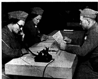
Im Katastrophenfall setzt sich auch die Frau mit all ihren zur Verfügung stehenden Kräften ein, um das Funktionieren sämtlicher wichtigen Einrichtungen zu garantieren. Unzählige wichtige Aufgaben warten ihrer innerhalb der verschiedenen Dienstzweige der örtlichen Zivilschutzorganisationen.