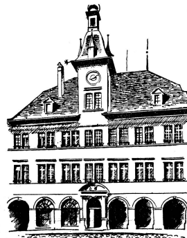
Rathaus in Lausanne: Hier tagen wir am 31. Mai

Mesdames les Présidentes, Mesdames les déléguées, Mesdames et Messieurs les membres individuels,