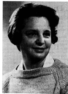
Wir stellen vor: