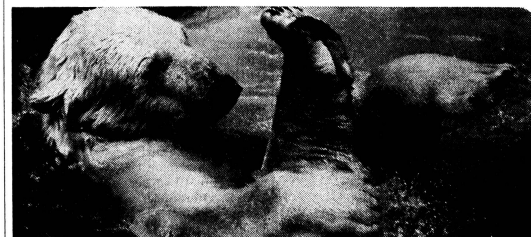
Wenn die Hundstage mit der Sauregurkenzeit zusammenfallen, geh' ich am liebsten ins Wasser... (C)