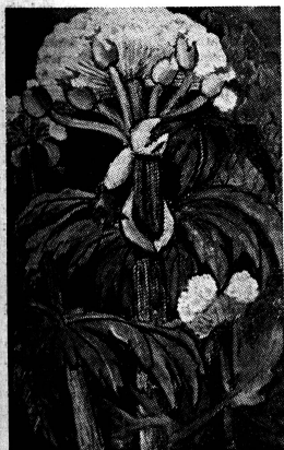
«Riesenkorbell», um 1953 (Kanton Zürich).