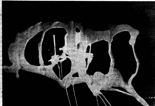
«Ross auf Schwarz», um 1958 (Privatbesitz).

lichkeit der späten Werke wandelt, ist die grosse Wirkung dieser Kunst wohl in erster Linie auf die in solcher Pugenlosigkeit sehr seltene Einheit von Mensch und Künstlerin zurückzuführen. Alles, was Helen Dahm malte, steht im Zeichen einer tiefen Wahrheit, die immer — auch in schweren Tagen — lebensbejahend dünkt. Dabei verliess die Künstlerin ihre Augen durchaus nicht vor den Bitternissen des Daseins, wie etwa ihre Themen mit dem Gekreuzigten beweisen oder auch ihre Motive mit dem Sündenfall und der Vertreibung aus dem Paradies. Und ihre oft in grauen Tönen gehaltenen Engel sind eher ernste Mahner als Freudenbringer. Dennoch wird das ganze Werk beherrscht von einem echten Optimismus, der ja auch Helen Dahm selbst — sogar in schwersten Tagen — nie verliess und der viel zu der beispiellosen Bedürfnislosigkeit der immer schenkbereiten Künstlerin beigetragen hat.