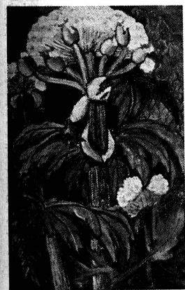
«Rosenkerbel», um 1953 (Kanton Zürich).

lichkeit der späten Werke wandelt, ist die grosse Wirkung dieser Kunst wohl in erster Linie auf die in solcher Pugenlosigkeit sehr seltene Einheit von Mensch und Künstlerin zurückzuführen. Alles, was Helen Dahm malte, steht im Zeichen einer tiefen Wahrheit, die immer — auch in schweren Tagen — lebensbejahend dünkt. Dabei verliess die Künstlerin ihre Augen durchaus nicht vor den Bitternissen des Daseins, wie etwa ihre Themen mit dem Gekreuzigten beweisen oder auch ihre Motive mit dem Sündenfall und der Vertreibung aus dem Paradies. Und ihre oft in grauen Tönen gehaltenen Engel sind eher ernste Mahner als Freudenbringer. Dennoch wird das ganze Werk beherrscht von einem echten Optimismus, der ja auch Helen Dahm selbst — sogar in schwersten Tagen — nie verliess und der viel zu der beispiellosen Bedürfnislosigkeit der immer schenkbereiten Künstlerin beigetragen hat.