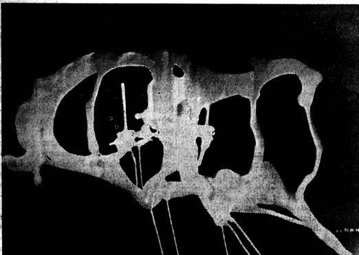
«Ross auf Schwarz», um 1958 (Privatbesitz).