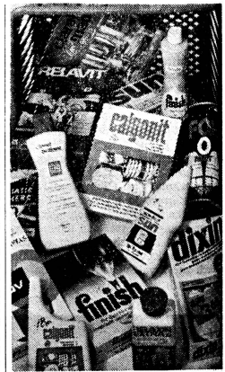
Dixin, Fox-o-mat, Finish und Relavit Extra.

Konsumentenforum der deutschen Schweiz und des Kantons Tessin (KF)