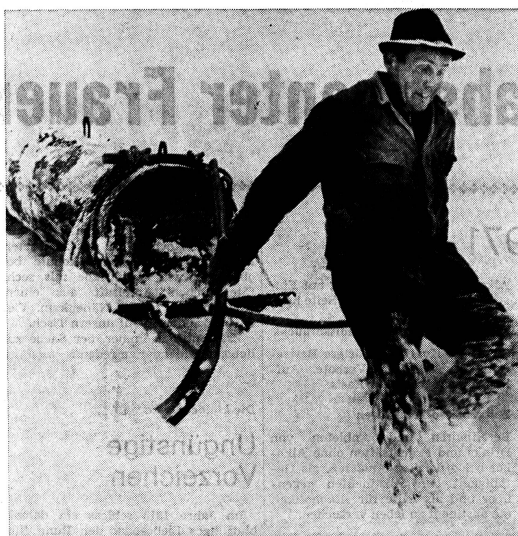
Gross sind die durch das Gelände und die Höhenlage bedingten Schwierigkeiten, mit denen unsere Bergbauern zu kämpfen haben. Umfangreich ist der Katalog unausschiebbarer Projekte, die zwar staatliche Subventionen genießen, deren Restkosten aber häufig das Leistungsvermögen der Betroffenen übersteigen. Es ist deshalb sinnvoll, wenn wir durch unsere Spenden die Schweizer Berghilfe in die Lage versetzen, auch dieses Jahr wieder wertvolle Entwicklungshilfe im eigenen Land zu leisten. Schweizer Berghilfe-Sammlung 1972, Postcheckkonto 80-32443, Zürich.

Ingrid Langer-El Sayed: «Frau und Illustrierte im Kapitalismus». Die Inhaltsstruktur von illustrierten Frauenzeitschriften und ihr Bezug zur gesellschaftlichen Wirklichkeit (Pahl-Rugenstein, Köln).