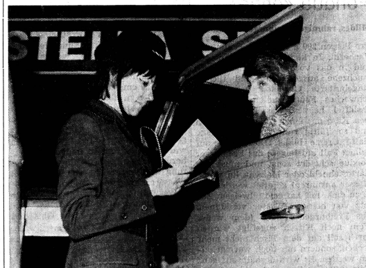
13 Polizei-Hostessen haben am 1. Dezember in Bern ihren Dienst aufgenommen. «Ganz in Rot» sollen sie ihren 40 männlichen Kollegen im Kampf gegen das Verkehrsschlamassel in der Bundesstadt beistehen. In einer viermonatigen Ausbildung sind sie mit den gleichen Kenntnissen ausgestattet worden wie die männlichen Verkehrsbeamten. Doch nicht nur ihre Kenntnisse sind gleich; auch ihre Rechte und Pflichten und, vor allem, ihr Lohn unterscheiden sich nicht von denjenigen der Männer. (P)

Insertionstarif: einseitige Millimeterzeile (27 mm) Fr. —.25, Reklamen (57 mm) Fr. —.75. — Annahmeschluss Mittwoch der Vorwoche.