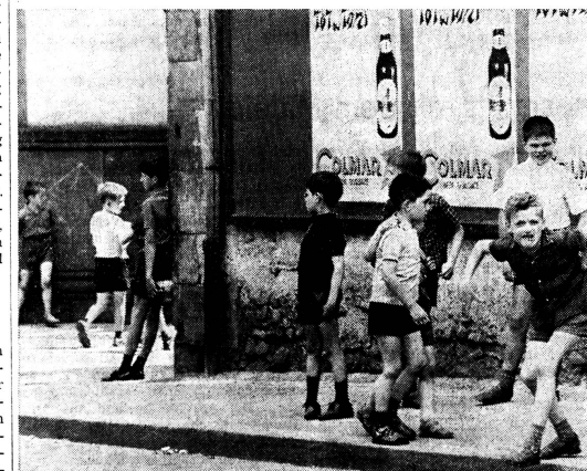
Diese Aufnahme wurde zwar im Elsass gemacht, sie illustriert aber die Spielplatznot der heutigen Stadtkinder treffend.

Gehörten 1929 vom gesamtschweizerischen Bankpersonal nur 18,4 Prozent dem holden Geschlecht an, so stellten 40 Jahre später in den Schweizer Banken die Frauen bereits 34,2 Prozent des Personals. Zum Vergleich: In den USA sind 69 Prozent und in skandinavischen Ländern gar bis zu 75 Prozent der Bankangestellten Frauen. Angesichts dieser Werte und der auch bei uns fortschreitenden Emanzipation der Frau darf erwartet werden, dass die Zahl der weiblichen Bankangestellten auch in der Schweiz weiter ansteigen wird. Welches sind die Tätigkeitsgebiete im Bankgewerbe, die für Frauen in Frage kommen? Arbeiteten sie früher vorwiegend als Sekretärinnen, Korrespondentinnen oder Buchhalterinnen, so haben sie es während der letzten Jahre verstanden, sich als Kassiererinnen, Übersetzerinnen, Hostessen und Werbeassistentinnen durchzusetzen. Die Automatisierung des Bankgeschäfts hat eine ganze Reihe neuer Berufe geschaffen, die genauso von Frauen wie von Männern belegt werden können. Frauen, die ausserdem über gute bankfachliche Spezialkenntnisse verfügen und sich führungsmässig bewähren, werden von ihren männlichen Kollegen anerkannt und haben alle Chancen, eine interessante Karriere zu machen. (SKZ)