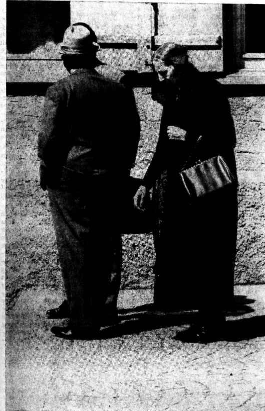
Im Schatten der Männer durfte (und darf vielerorts heute noch) das «leider notwendige Uebel» sein. Dasen in fristen und dafür sorgen, dass der Mann auf keine Bequemlichkeit verzichten musste beziehungsweise muss...

Wir erklärten uns das mit den lebenden «Fischjungen» so, dass es halt