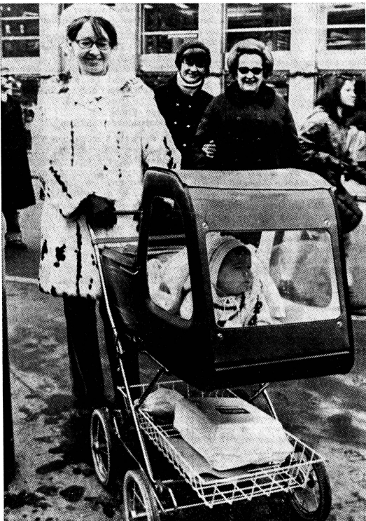
Bauchlage-Babies wollen auch etwas von der Welt sehen. Wenn das Kind «abschalten» möchte, schliesst Mama die Sonnenblenden.