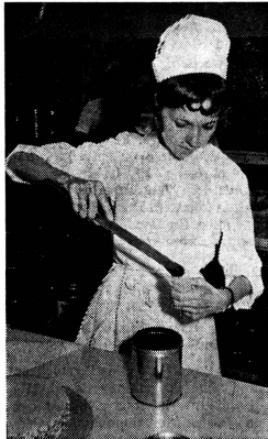
Schweizerin gewann internationalen Bäckerwettbewerb

Mit diesem Appell schloss für die frisch diplomierten Schwestern der Pflegerinnenschule eine Ausbildung, die betont im Zeichen dieser Ideale stand.