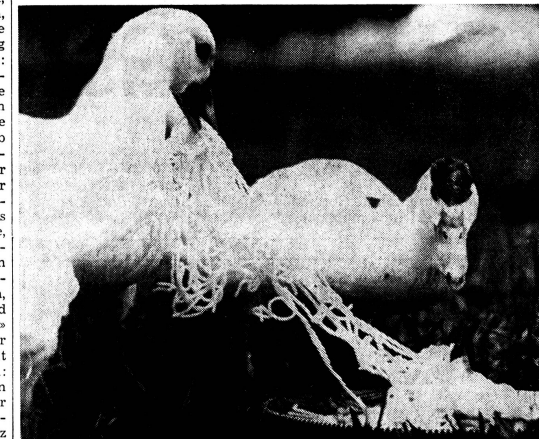
Was sind denn das für Tischmanieren? (C)