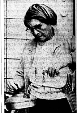
Wasser als Markenartikel im Tetrapack?

Eine der dümmsten Behauptungen im Werbefernsehen ist jene, die besagt, das X-Wässchen sei richtig für jene, die sich eine individuelle Note zu verleihen wünschen. Eine individuelle Note für einen Artikel, für den im grössten Massenmedium aller Zeiten, dem Fernsehen geworben wird! Heinz Reih