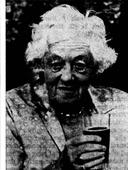
Die britische Charakterchauspielerin Dame Margaret Rutherford, die in aller Welt durch die Darstellung exzentrischer Engländerinnen zu grossem Filmruhm gelangte, ist am Pfingstmontag im Alter von 80 Jahren in London gestorben.

Der Direktionsrat der «London Stock Exchange» kündigte an, auch Frauen dürften vom 25. März 1973 an die heiligen Hallen dieses Finanzpalastes betreten, die seit über 150 Jahren nur Männern vorbehalten waren.