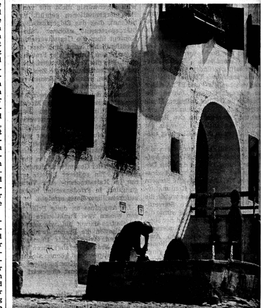
Wäscherin am Brunnen von Guarda, Engadin.