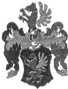
Adelswappen von 1558 und 1629, Chur. Greif-und Verbesserung, Nr. 4 und 5.