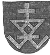
Modifizierte Hauszeichen Wappen der Berner Linie, Nr. 2, 2B.