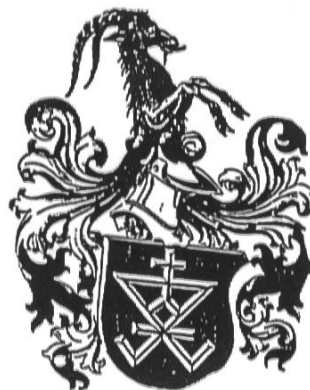
Modifizierte Hauszeichen Wappen der Berner Linie, Nr. 3.