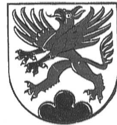
Greif-Wappen Gemeinde Feldis Nr. 6.