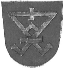
Vor 1471, Wappen mit Goldenem Hauszeichen, Chur/Feldis Nr.1