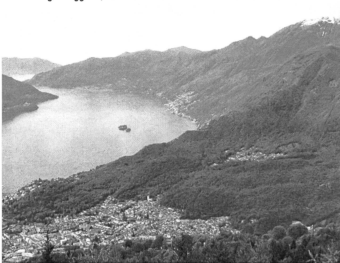
Lago Maggiore mit Brissago-Inseln und Ausblick bis weit in die Lombardei hinein.