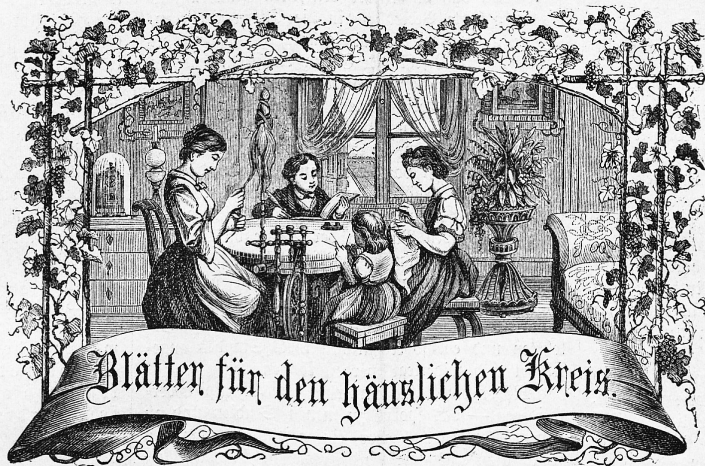
Motto: Immer strebe zum Ganzen; — und lausni Du selber kein Ganzes werden, Als dienendes Glied schließ' an ein Ganzes Dich an.