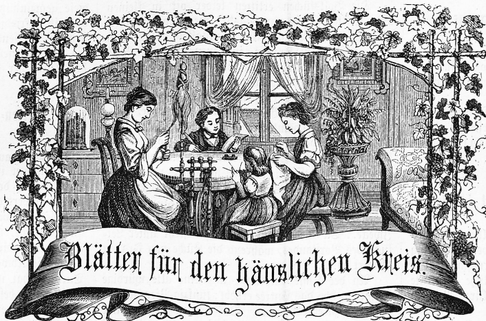
Wort: Immer strebe zum Ganzen; — und kannst Du selber kein Ganzes werden. Als dienendes Glied schlies' an ein Ganzes Dich an.