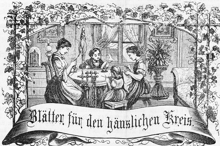
Motto: Immer strebe zum Ganzen; — und damit Du selber kein Ganzes werden. Als dienendes Glied schlies' an ein Ganzes Dich an.