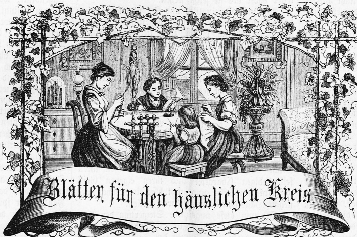
Motto: Immer strebe zum Ganzen; — und kannst Du selber kein Ganzes werden, Als dienendes Glied schlies' an ein Ganzes Dich an.